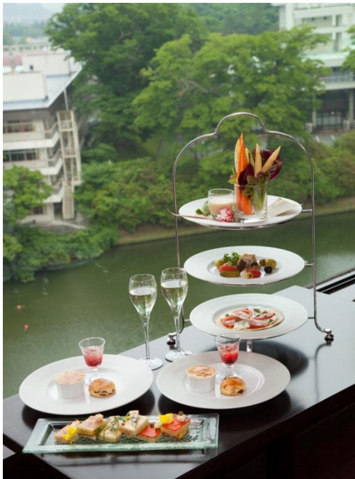
・オトナ女子会 バー「ロータス」