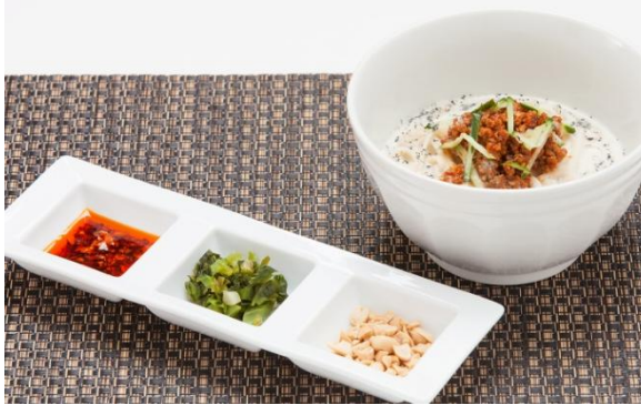
・冷やしホワイト坦々麺 ダイニング&カフェ 「キャッスル・ハウス」