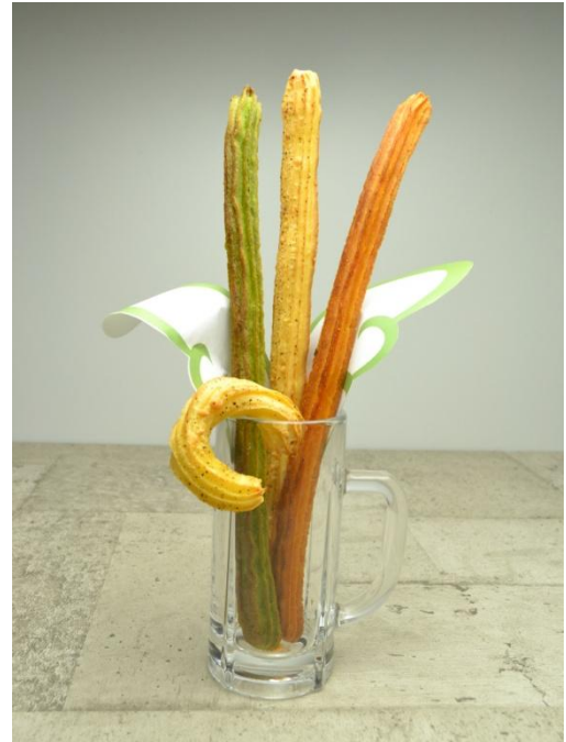
・焼きチュロス「ベジーズ」 ビヤガーデン キャッスル The 大盆踊り大会