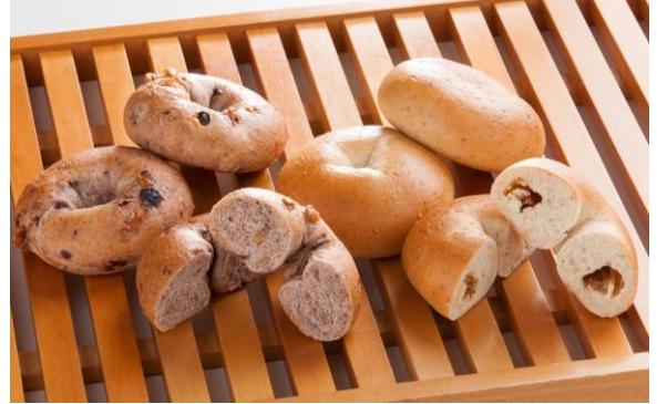
・ブラン&グラハムベーグル グルメブティック「セレクト」