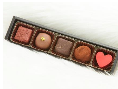
ボンボンチョコレート

女性パティシエが一粒ひとつぶ丁寧に作り上げるボンボンチョコレートは、この季節だけのお楽しみ。今年「和」テイストで5つの味を詰め合わせました。大切な方への贈り物はもちろん、ご自身へのご褒美に。