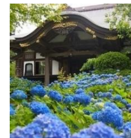
男鹿市・雲昌寺(うんしょうじ)