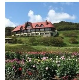
秋田市・秋田国際ダリア園

●本体サイズ:H9×W30×D15(cm) ●賞味期限:常温14日間 ●秋田県の花材:アジサイ、ダリアなど