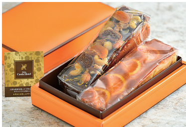
パウンドケーキ(小) ナッツ&オレンジ