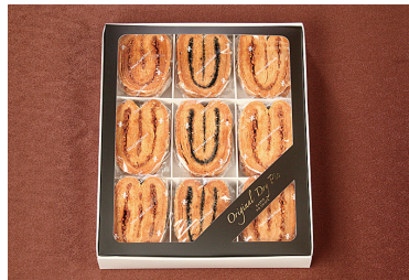
ドライパイ(27枚入り)