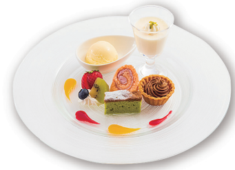
スイーツセレクション