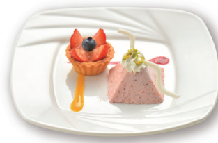
苺のムースとベリータルト