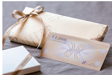
秋田キャッスルホテル商品券