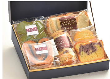
ホテルメイドスイーツ 詰め合わせ I