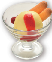
ホテルメイドバニラアイス

(表示価格は消費税・サービス料込) ●表示価格はおひとり様の価格です ●器が変更になる場合がございます